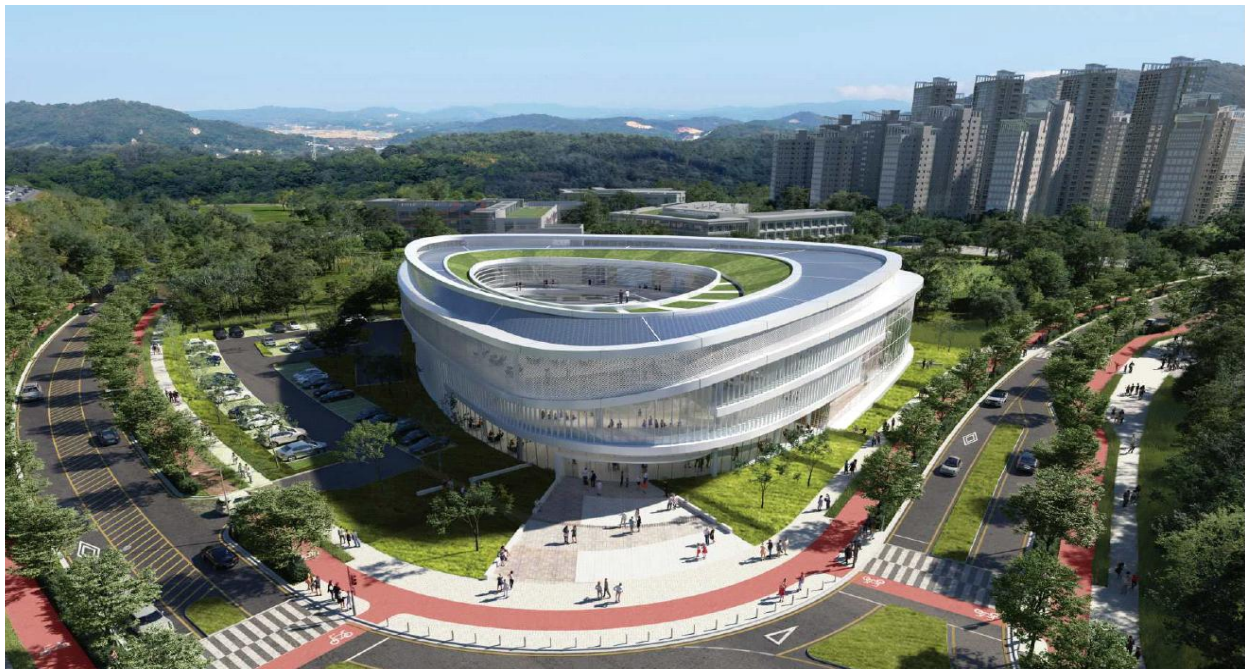
〈 조 감 도 〉